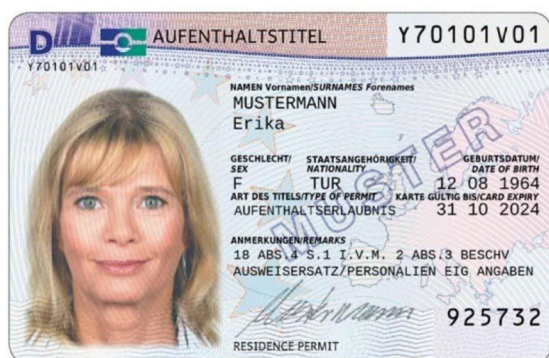
© Федеральне міністерство внутрішніх справ (Bundesministerium des Innern)